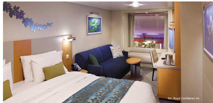
fol. Royal Caribbean Int.

Podróżujący w tych wydzielonych apartamentach pasażerowie nie muszą korzystać z ogólnych barów i restauracji,